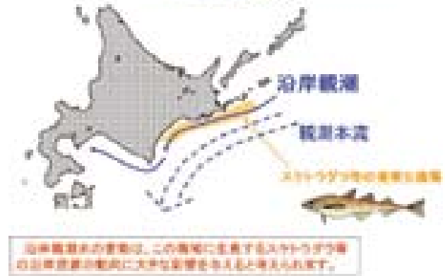
図1 沿岸親潮の様子を示す模式図