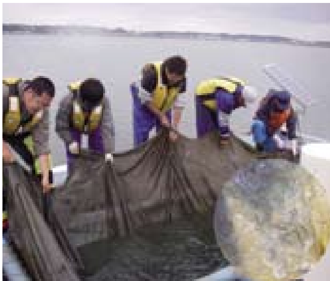
厚岸湾でのニシン放流風景

技術開発に着手した当時は、厚岸ニシンの漁獲量は極めて少なく、産卵親魚の確保すら困難なため、未成魚を親魚に養成して産卵、種苗生産を開始しました。昭和62年から厚岸湾での種苗放流を開始しました。その後、厚岸ニシンの漁獲は増減しながらも増加傾向を示し、今年（平成20年）は336トン（9月末までの暫定値）と34年ぶりの大漁を記録しています（図1）。