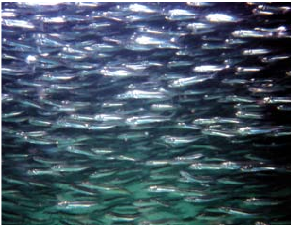
ニシン稚魚の群遊 (詳細については研究情報を参照願います)

研究情報 ニシン資源の回復を目指して!! トピックス 北海道区水産研究所運営会議報告 研究室紹介 (連載第1回) 資源評価研究室