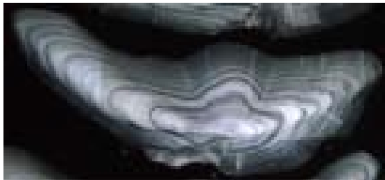
スケトウダラの耳石の断面写真。 輪紋の観察より、写真の個体は9歳と推定。

当研究室で研究を行っている魚の中では、スケトウダラに最も力を注いでいます。スケトウダラは“たらこ”や“すり身”の原料として有名ですが、北海道で水揚げされる魚の24%の量を占める重要な漁業資源です。しかし、このスケトウダラの漁獲量は近年減少しており、特に日本海側では10年前の25%以下となってしまいました。今後もスケトウダラを安定して漁獲するためには、この減少した原因を解明し、有効な対策を立てることが必要となります。