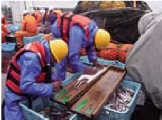
船上でのスケトウダラの測定

資源評価研究室には研究員4名、研究支援職員1名、研究補助職員4名の計9名が所属しています。当研究室ではスケトウダラやマダラなど、北部日本周辺海域における底魚類を対象に、今年ほどのくらいの資源があるのか、どのくらいの量まで漁獲してよいのか、魚の資源量の変化はなぜ起こるのかなどの、資源の管理を旨とす調査・研究を行っています。