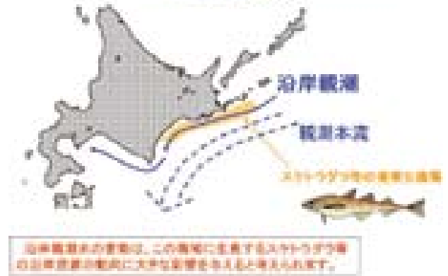
図1 沿岸親潮の様子を示す模式図